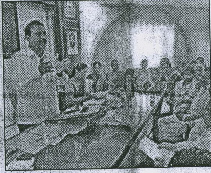
शुरू किया जा रहा है। इस अभियान के

उल्हासनगर। उल्हासनगर मनपा के स्वास्थ्य विभाग द्वारा की गई जांच में ऐसी बात सामने आई है कि उल्हासनगर के 168 परिवार अभी भी खुले में शौच करने को मजबूर हैं। इस वजह से मनपा प्रशा इन परिवारों के लिए स्वच्छ महाराष्ट्र अभियान मुहिम के अंतर्गत व्यक्तिगत घरेलू शौचालय बनाकर देने और खुले में शौच करने से उल्हासनगर को मुक्त कर रही है। उल्हासनगर मनपा की तरफ से स्वच्छ महाराष्ट्र अभियान